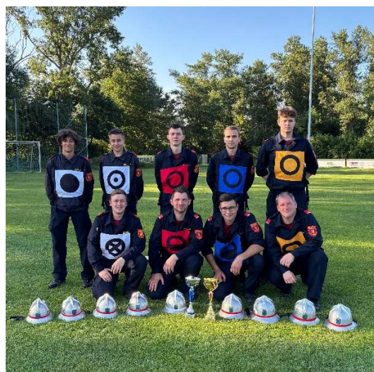
Bezirksfeuerwehrleistungsbewerb in Frohsdorf