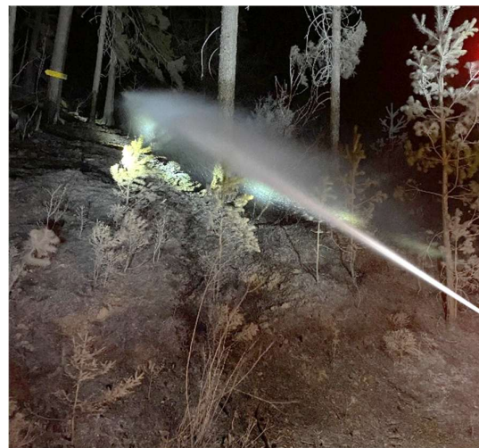
Waldbrand Schwarzau im Gebirge