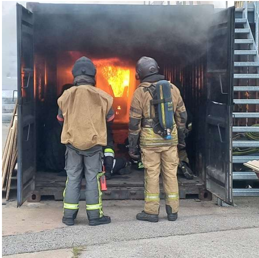
Ausbildung Atemschutzstufe 5

Im November nahm ein Atemschutztrupp an der Ausbildung zur Atemschutzstufe 5 bei ready4fire in Amstetten teil. Bei dieser Ausbildung wird in einem Brandcontainer ein Zimmerbrand realitätsnah simuliert. Die Kameraden wurden dabei Feuer und Rauchgase ähnlich einem Brand in einer Wohnung ausgesetzt.