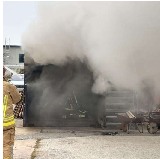
Ausbildung Atemschutzstufe 5