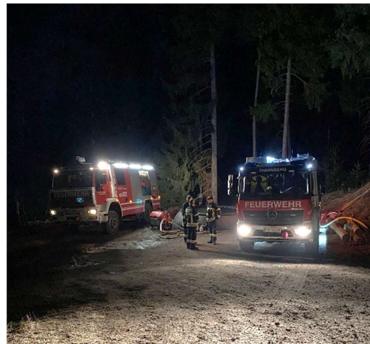
Waldbrand Schwarzau im Gebirge

Im März wurde unser HLFA2 im Rahmen des Katastrophenhilfsdienstes zu einem großflächigen Waldbrand nach Schwarzau im Gebirge angefordert. Unsere Mannschaft war rund zwölf Stunden im Einsatz, um Löschwasser zu fördern und Benetzungsmaßnahmen zur Eindämmung der Flammen durchzuführen.