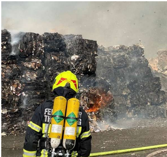
Großbrand Papierfabrik Pitten

alarmiert. Das Feuer konnte rasch unter Kontrolle gebracht werden. Zwei Personen mussten mit Rauchgasvergiftung bzw. Brandverletzungen versorgt werden.