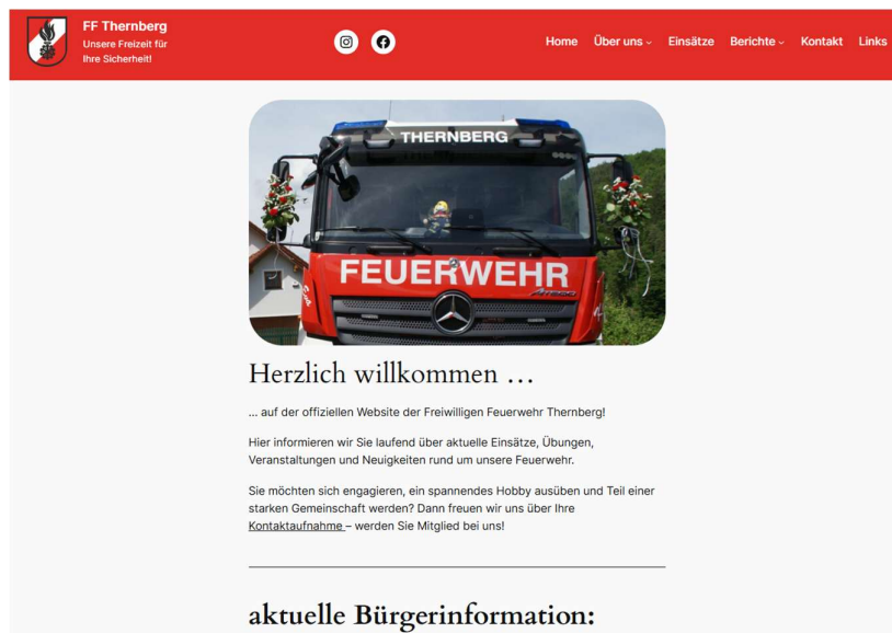
Neu gestaltete Homepage

Zusätzlich stehen Ihnen unsere Social-Media-Kanäle auf Facebook und Instagram weiterhin wie gewohnt zur Verfügung. Dort informieren wir ebenso regelmäßig über aktuelle Einsätze, Veranstaltungen und Neuigkeiten rund um die Feuerwehr Thernberg. Folgen Sie uns, um immer auf dem Laufenden zu bleiben!