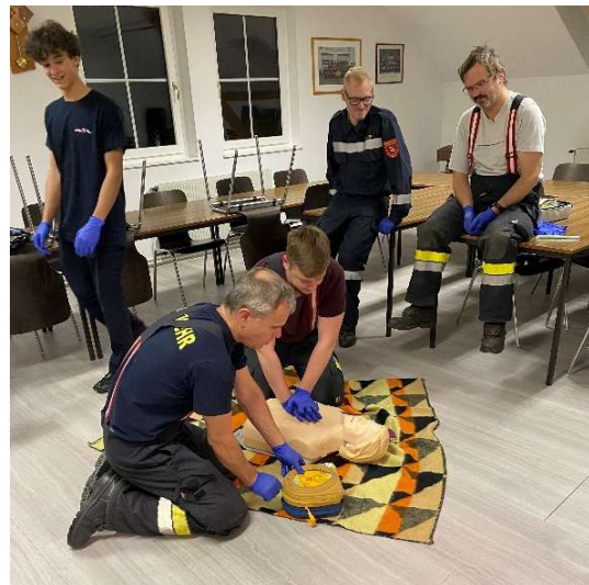
Übung Erste Hilfe im Feuerwehreinsatz

Im Herbst wurden zusätzlich noch weitere Ausbildungspunkte wie ein Fahrzeugbrand