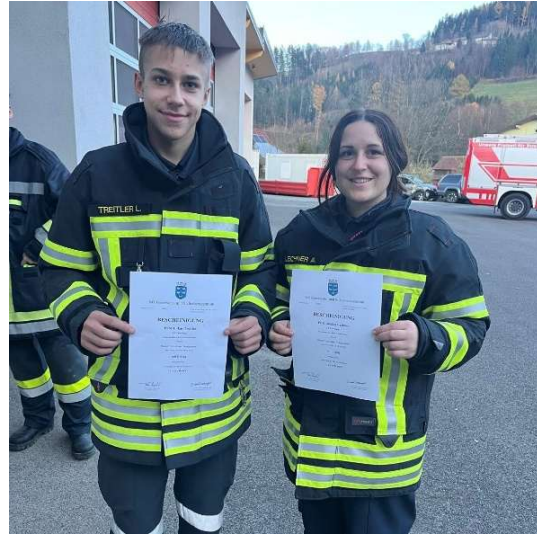
Die neuen Feuerwehrmitglieder nach bestandener Basisausbildung

somit die Ausbildung erfolgreich abgeschlossen.