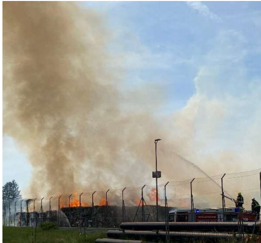
Großbrand Papierfabrik Pitten

Ein besonders intensiver Einsatz ereignete sich im Juni bei einem Großbrand in der Papierfabrik Hamburger in Pitten. Gemeinsam mit rund 50 Feuerwehren und 500 Einsatzkräften kämpften wir über 65 Stunden gegen die Flammen. Unsere Atemschutztrupps standen im Dauereinsatz, um das Übergreifen des Brandes auf angrenzende Gebäudeteile zu verhindern.